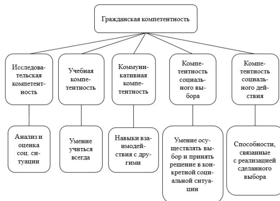
Рис. 2. Сущность компетентностного подхода к гражданскому воспитанию

отличается от вышеуказанных методологий, предполагая, что в гражданском воспитании наиболее важное значение имеет формирование качеств личности, способствующих адекватной оценке тех или иных ситуаций, затрагивающих вопросы права, закона, свобод, обязанностей, государства и т. п. При таком подходе в гражданском воспитании требуется усвоение достаточных знаний и формирование умений ими пользоваться. И. В. Шишкина рассматривает природу и сущность гражданской компетентности (рис. 2) [18, с. 192].