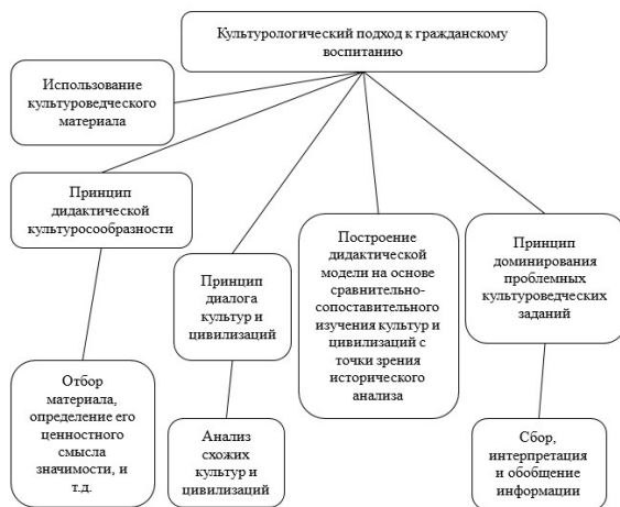
Рис. 1. Сущность культурологического подхода к гражданскому воспитанию

опирающемуся на определенные принципы (рис. 1) [15; 16, с. 18; 17]. Этнопедагогический подход принципиально схож с культурологическим, но ориентируется на формирование межэтнических толерантных качеств личности, предполагая воспитание терпимости, этичности и взаимопонимания. Поэтому на основании этнопедагогического подхода могут использоваться средства и принципы, отраженные на рис. 1.